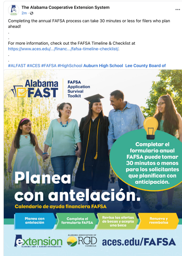
Ejemplo de publicación en redes sociales.

Mito: FAFSA es sólo para los estudiantes que planean seguir un grado asociado o licenciatura. REALIDAD Varios programas de las universidades comunitarias o técnicas de 2 años dan derecho a ayuda. Para obtener más información sobre estos y otros mitos comunes de la FAFSA, visita www.aces.edu/fafsa .